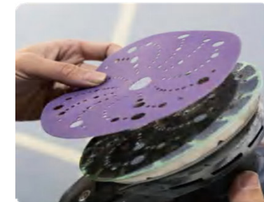
TL737 – Disco abrasivo viola in ceramica, foratura multipla

Grana: Ceramica Dimensione: 150 mm Colore: Viola Attacco: Sistema a strappo (Velcro) compatibile con levigatrici orbitali rotanti Supporto: in carta Legante: Resina su resina Foratura : multipla Grane disponibili: P80.120.240.320 Tipologia di rivestimento: Aperta (Open Coat)